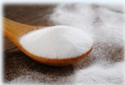
Опыт № 2