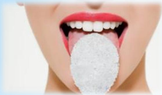
Опыт № 4